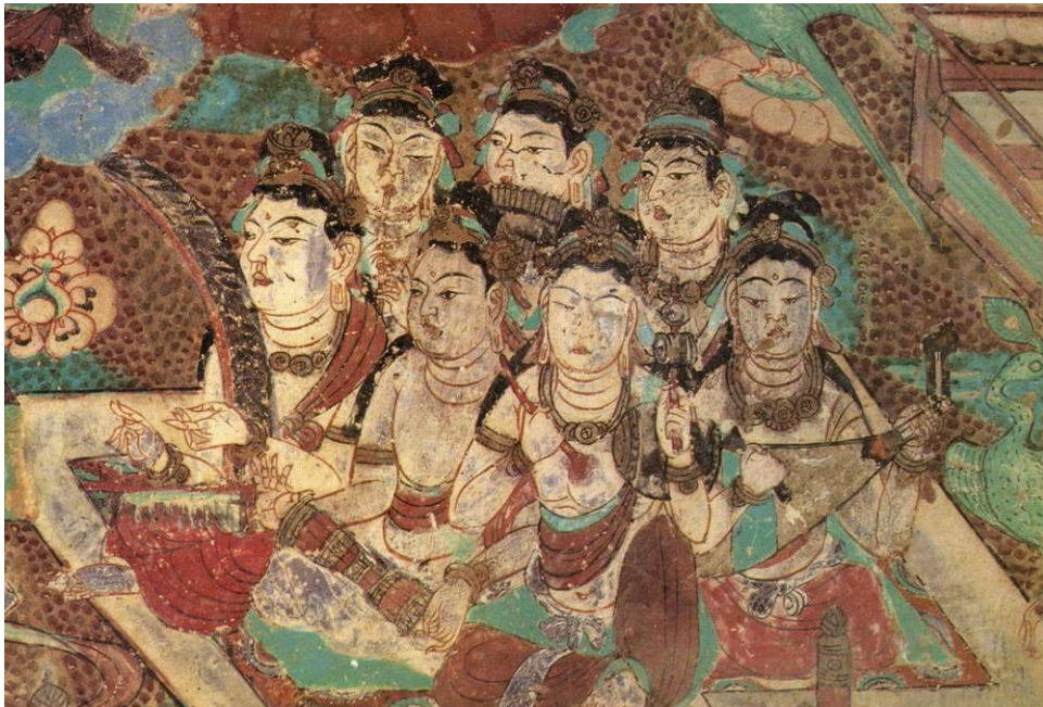
上圖：敦煌盛唐 45 窟北壁中部東側

並看到敦煌莫高窟唐代的經變圖中，禮佛樂伎們同時演奏著形制與奏法如同南管琵琶的梨形撥弦樂器，以及各式各樣像極現今南印民間的手鼓。這些訊息彷彿提供了一道曙光，將兩個世界的樂器聯繫了起來；雖然這南管與印度的樂種看似毫不相關，但在千年餘前卻以另一種姿態共享過同一個舞台。