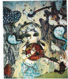
新疆克孜爾，3 th C

目前關於「絲路」或「胡漢音樂」交流的音樂歷史，由於文獻的限制，多集中於隋唐時期長安、洛陽等京城地區的研究，較少能夠觸及隋唐之前數百年間民族遷徙頻繁的北朝十六國，及其所處的西北地域，更不用提西域的各個綠洲城邦。現今的甘肅與新疆，因其特殊的地理形勢使然，以綠洲為節點，透過商業往來成為古代中西文化的交流集散之地，已是眾所皆知。然而當時講著各異語言的吐火羅人、塞人、月支人、羌藏、鮮卑民族，其音樂文化為何，是如何交流改變並影響中原的音樂？