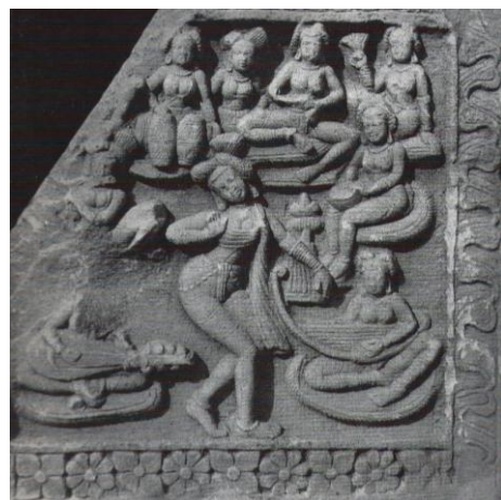
Gwalior, India, 5-6 th C

此外，書籍上的照片亦有觀點上的侷限，例如立體的雕塑以平面形式呈現時，經常會產生辨別上的困擾，而石窟中的壁畫，只拍攝了局部的圖像，卻不知身處在石窟中的空間感為何，樂舞圖像被佈局在那個位置，所產生的心裡效果又為何。佛教的藝術往往是以宗教的實用目的產生，所以除了書本上的觀看，更需要在實體的周遭體驗其整體的效果，以推測其創造意圖。