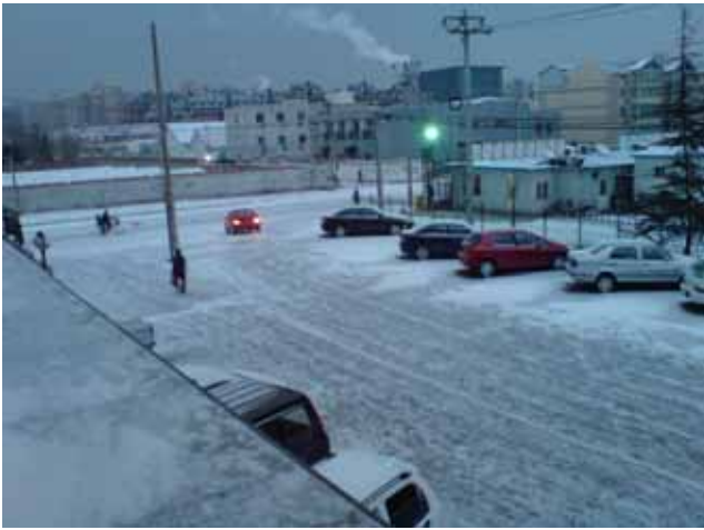
從住處二樓公寓望出去的清晨六點，北京今年第一場雪，二月十七