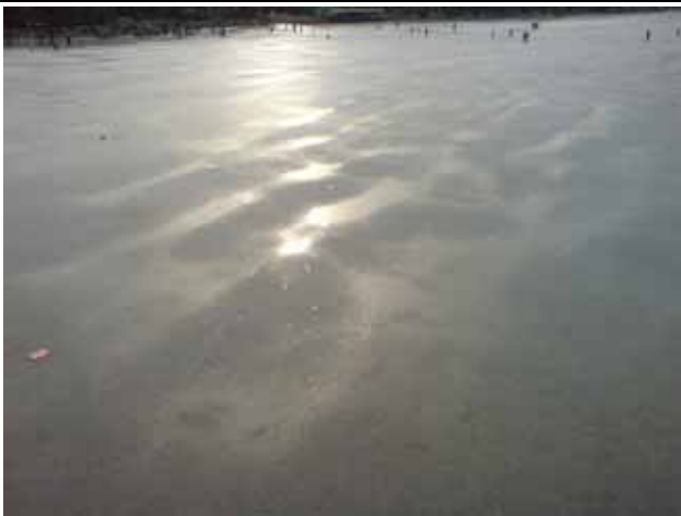
結冰的紫竹園，二月七日，北京