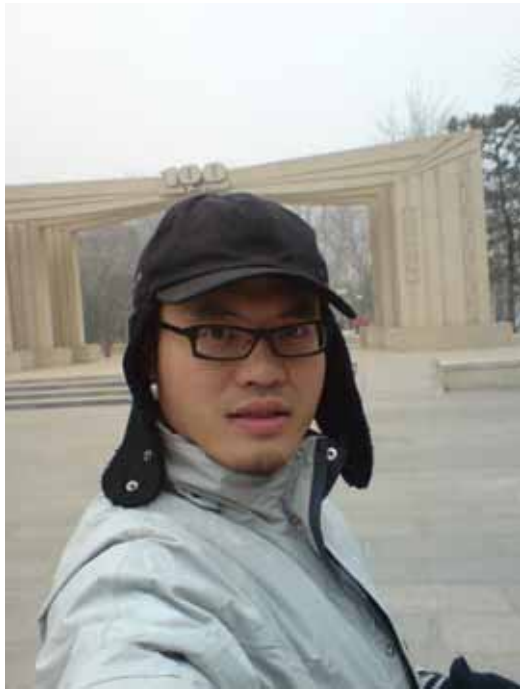
中國話劇百年紀念碑，三月四日，北京