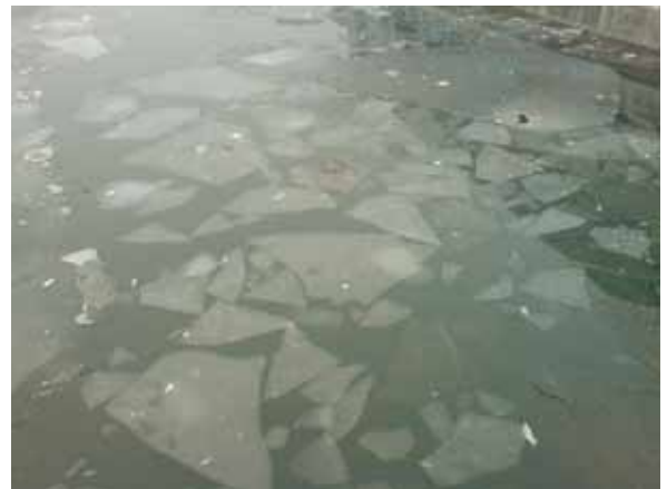
融冰的昆玉河，三月四日，北京