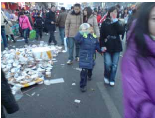
年節期間逛琉璃廠廟會垃圾滿地人滿為患約至下午 5 點即廣播驅散群眾，一月二十六，北京