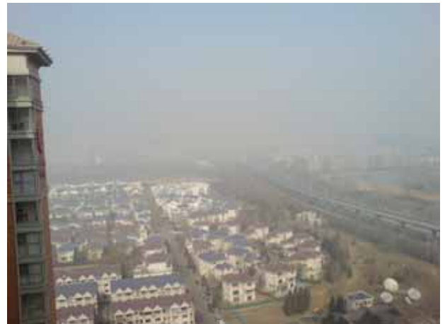
元宵期間遷入葛璟嬌先生新購的奧運村附近公寓，並與葛璟嬌密集上課 10 天，23 層望去煙霧瀰漫，北京