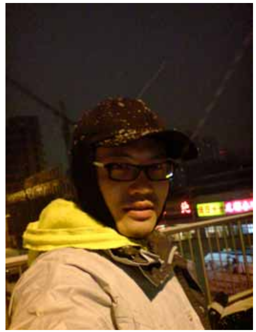
雪一直下到晚上，二月十七，北京