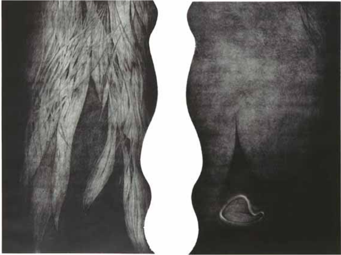
另一種溝通的方式 2000