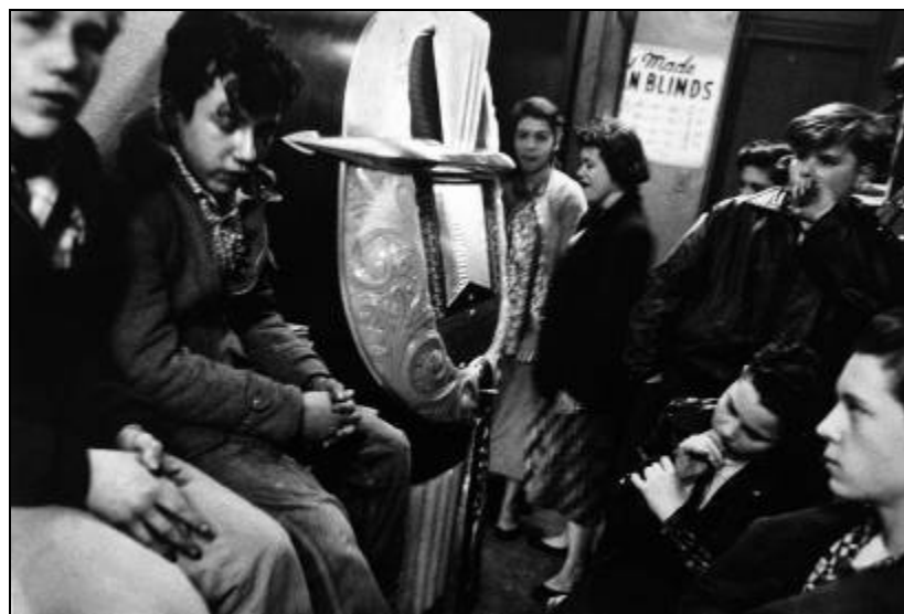
Candy store - New York City

「Robert Frank，瑞士人，安靜，友善，帶著可單手舉起並按快門的小型相機，吸吮着一首美國的哀詩，映在底片上，足與世上的悲劇詩人齊名。」——Jack Kerouac