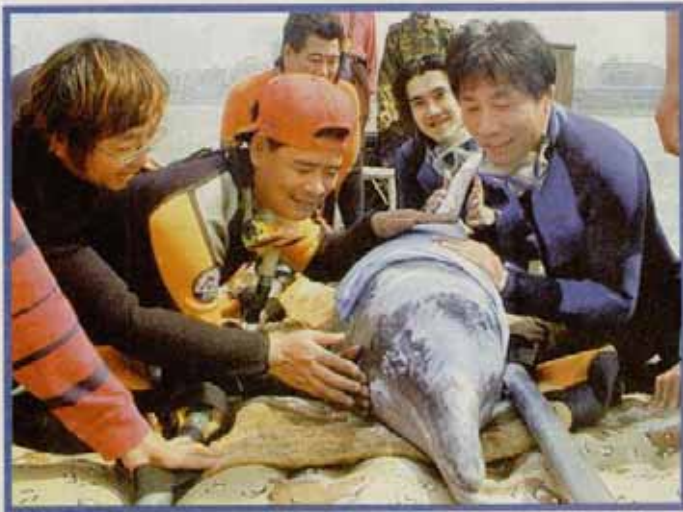
鯨豚保育人士經過細心籌劃營救過程，當第一隻齒鯨海豚獲救後，眾人不斷撫摸海豚，平復其驚恐情緒。